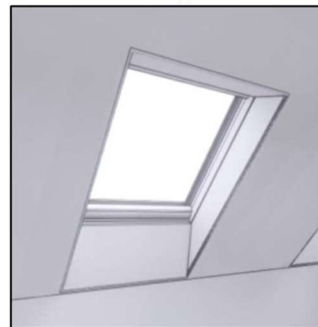
Vlakke aftimmering (=optioneel)