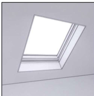
Haakse aftimmering (= "standaard")

Het één en ander wordt uitgevoerd conform tekening.